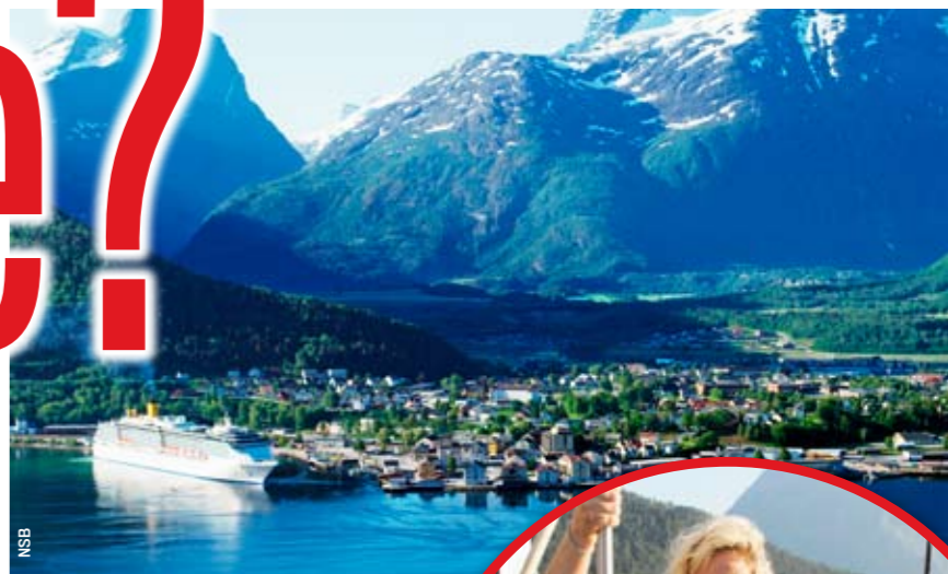
CRUISEHAVN: Store cruiseskip har anløp i Åndalsnes, og turister fra hele verden strømmer inn i det flotte fjellandskapet før de reiser videre.