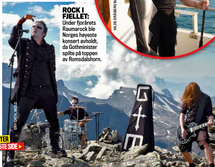
ROCK I FJELLET: Under fjorårets Raumarock ble Norges høyeste konsert avholdt, da Gothminister spilte på toppen av Romsdalshorn.