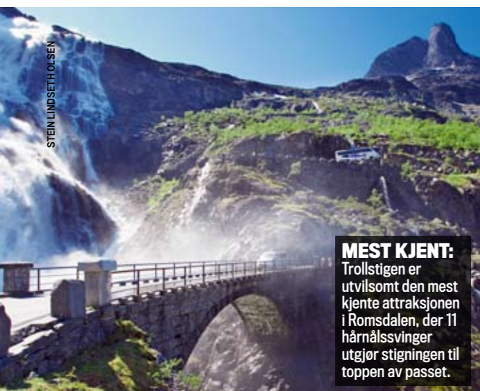
STEIN LINDSETH OLSEN