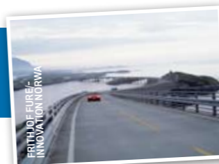
FRITHJOF ELURE/INNOVASJON NORGE